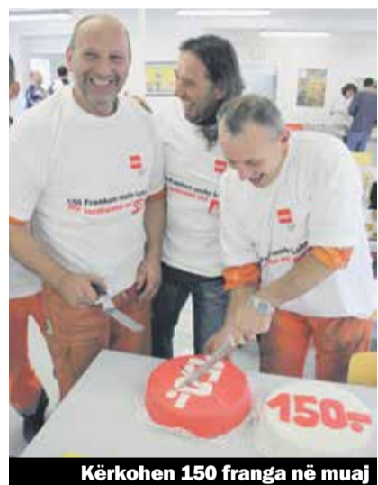
Kërkojnë 150 franga në muaj