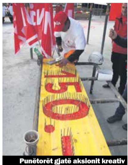
Punëtorët gjatë aksionit kreativ

Situata e mirë në sektorin e ndërtimtarisë pasqyrohet gjithashtu edhe në punës të rëndë e punëtorëve të ndërtimtarisë. Ngritja e pagave nuk është fare proporcionale me ngritjen e fitimeve. Ndërsa punëtorët e ndërtimtarisë duhet të paguajnë edhe më shumë për premitë e arkave të shëndetësisë dhe më shumë për qira banimi. Një ngritje