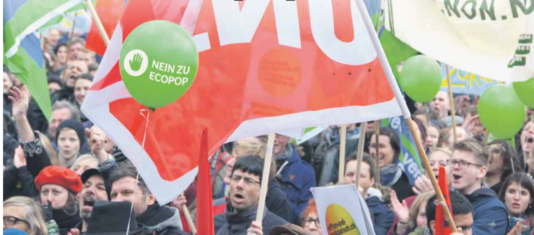
Manifestimi në fjalë si shenjë kundër iniciativave që bëjnë fajtor migrantët për problemet vendore

Më 30 nëntor do të votohet mbi iniciativën popullore «Stop mbipopullimit – Për sigurimin e mjeteve natyrore të jetesës». Edhe pse të gjitha partitë janë deklaruar kundër saj, iniciativa mbetet e rrezikshme, pasi ajo tematizon halle të ndryshme të shumë njerëzve. Ne duhet të kundërshtojmë këtë politik të fajësimit të migrantëve dhe të luftojmë për një Zvicër të hapur dhe solidare