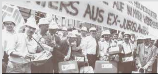
Pamje nga protesta e sezonierëve të ish-Jugosllavisë