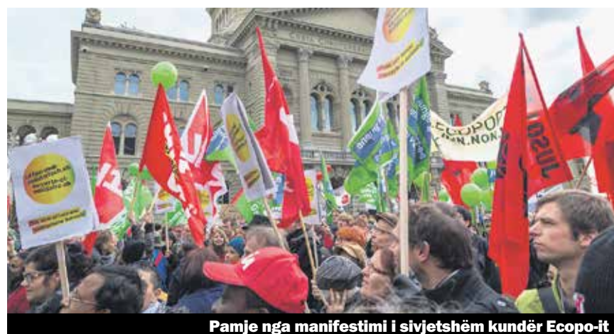
Pamje nga manifestimi i sivjetshëm kundër Ecopop-it

Drejtor i Fondacionit Ecopop dhe anëtarë i komitetit qendror të Unia-s