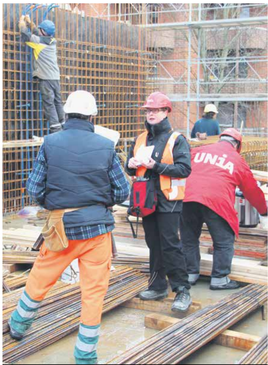
Punëtorët kanë të drejtë të informohen mbi të drejtat e tyre nga sindikatat

Ndodhë përsëri e përsëri: Sindikalistët paditën për dhunimin e qetësisë shtëpiake, pasi që me punëmarrësit bisedojnë në vendet e tyre të punës. Me këtë rast situata ligjor është e qartë – dhe pos kësaj edhe gjyqi i qarkut të Cyrihut i ka dhënë të drejtë Unia-s.