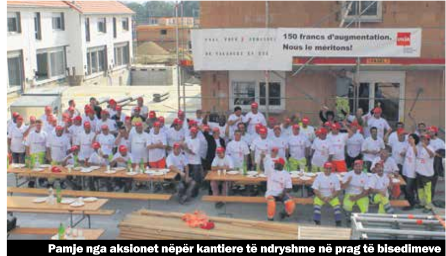
Pamje nga aksionet nëpër kantiere të ndryshme në prag të bisedimeve

pagash prej 150 frangave në muaj si kërkesë nuk është fare e tepruar.