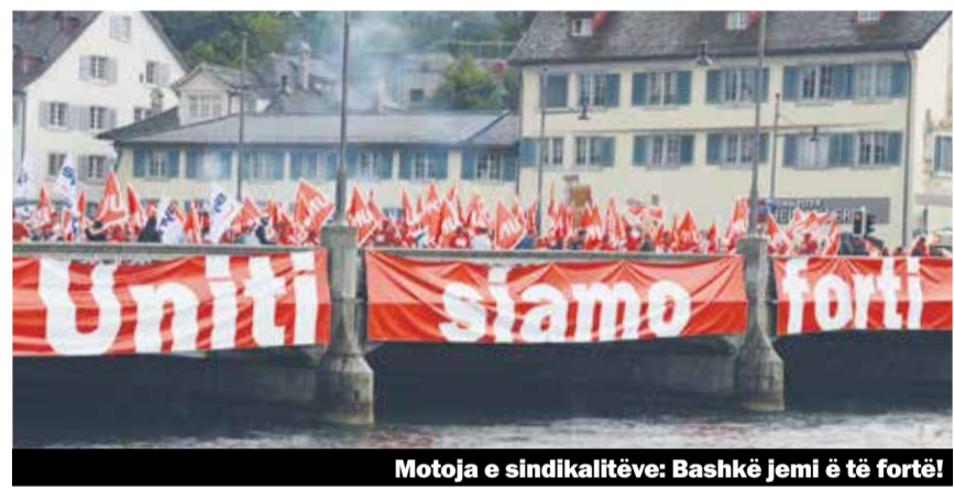
Motoja e sindikalitëve: Bashkë jemi ë të fortë!