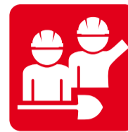
Fitoni me Unia.

Bisedimet nuk janë përmbyllur tërësisht. Palët kontraktuese janë obliguar që të gjitha piket e hapura të negociojnë deri në mesin e vitit 2017.