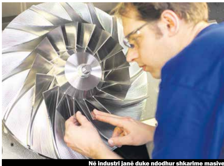
Në industri janë duke ndodhur shkarkime masive