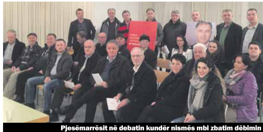
Pjesëmarrësit në debatin kundër nismës mbi zbatim dëbimit

Krahas diskutimit me të pranishmit mbi nevojën e mobilizimit për të votuar kundër iniciativës në fjalë u diskutuan edhe mundësitë e mbështetjes sa më të madhe për të votuar kandidatët shqiptaro-zviceran, që ishin pjesëmarrës të tryezës kundër nismës në fjalë. Më poshtë po portretizojmë shkurtë kandidatët pjesëmarrës të këtij paneli: