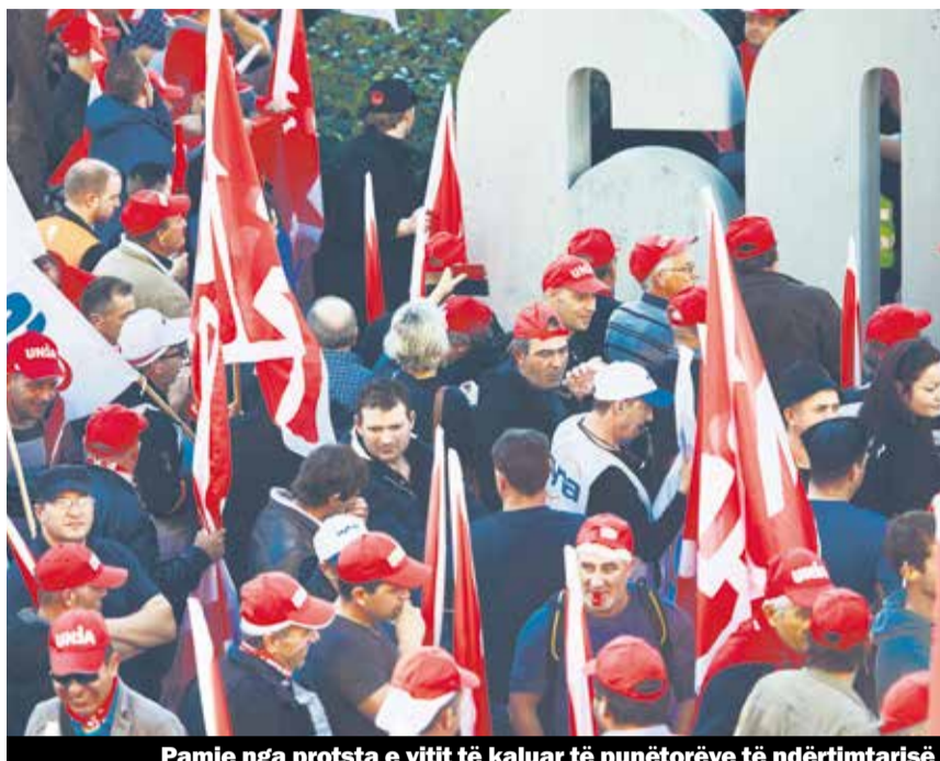
Pamje nga protsta e vitit të kaluar të punëtorëve të ndërtimitarisë

Shoqata Zvicerane e Punëdhënësve dhe sindikatat Unia e Syna janë pajtuar për Kontratën Kombëtare të Punës për Ndërtimtarin e cila vlen nga fillimi 2016 deri në fund të vitit 2018. Ajo pëson pak përshtatje. Pos tjerash është siguar pensionimi me 60 vjet pa reduktime përfitimsh.