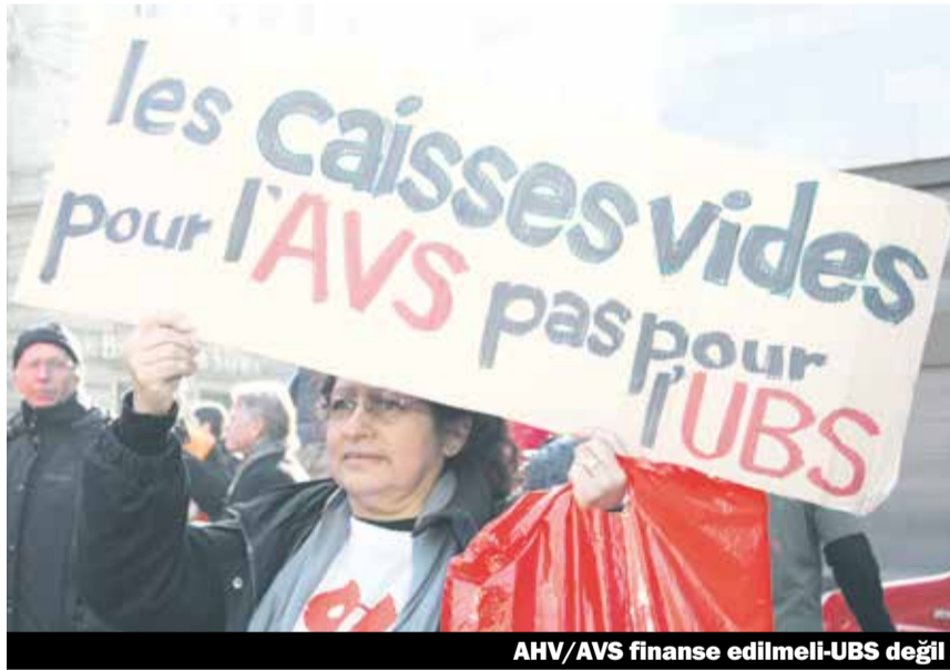
AHV/AVS finanse edilmeli-UBS değil

Kantonlar konseyi 9 haziran da, halk inisiyatifi AHVplus/AVSplus «daha güçlü bir emeklilik» i tartıştı. Tahmin edildiği gibi, burjuva partilerinin talebi çoğunluk tarafından kabul edildi. AHV/AVSplus «ekonomik nedenlerden dolayı finanse edilemez» denildi, oysa İsviçre'de bunu finanse edebilecek para bulunmaktadır. Bu inisiyatif önümüzdeki yıl halk oylamasına sunulacak. Fakat bizlerin çalışmalarına şimdiden başlaması gerekiyor. Emeklilik maaşının artırılması acil bir taleptir, bu talebin mutlaka kabul edilmesi gerekir!