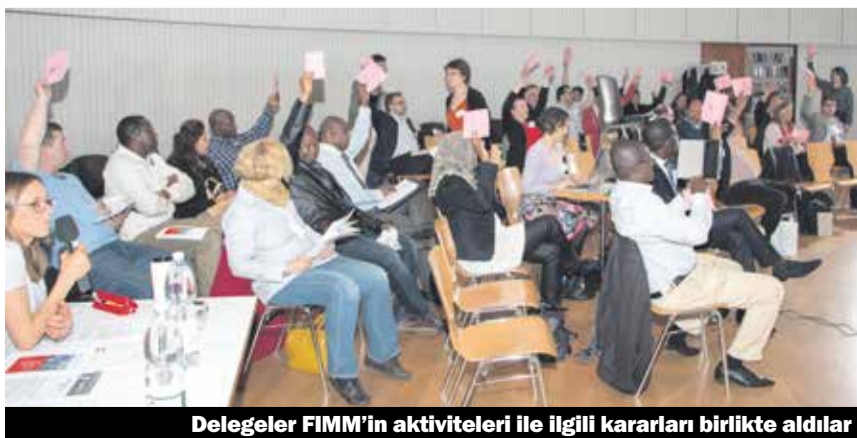
Delegeler FİMM'in aktiviteleri ile ilgili kararları birlikte aldılar