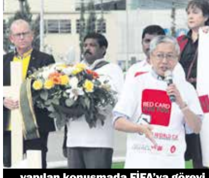
yapılan konuşmada FIFA'ya görevi hatırlatıldı

Uzun bir süre önce, UYAİF «FİFA için kırmızı kart-ışçi hakları olmadan dünya futbol şampiyonasıda yok» kampanyası başlattı. UYAİF kampanya ile hem inşaat işçilerinin yaşam koşullarını iyileştirmek, hemde işçi haklarını iyileştirmek istiyor. Katar'da kafala sistemi (her iş için,