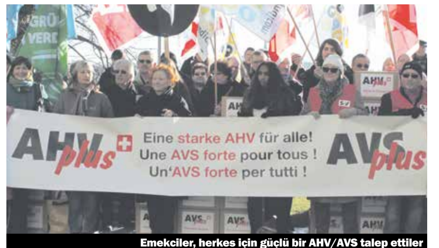
Emekliler, herkes için güçlü bir AHV/AVS talep ettiler