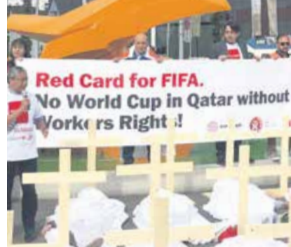
FİFA'ya kırmızı kart verildi