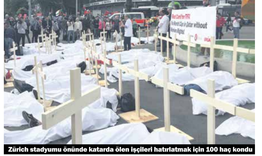
Zürih stadyumu önünde katarda ölen işçileri hatırlatmak için 100 haç kondu

bir patronun işçiye çalışma müsadese ve bir pasaport vermesi gerekiyor) nedeniyle sendikaya üye olamıyor ve böylelikle işverene, patrona teslim ediliyor.