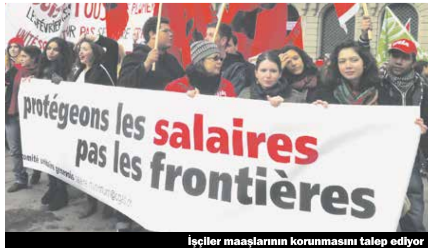
İşçiler maaşlarının korunmasını talep ediyor