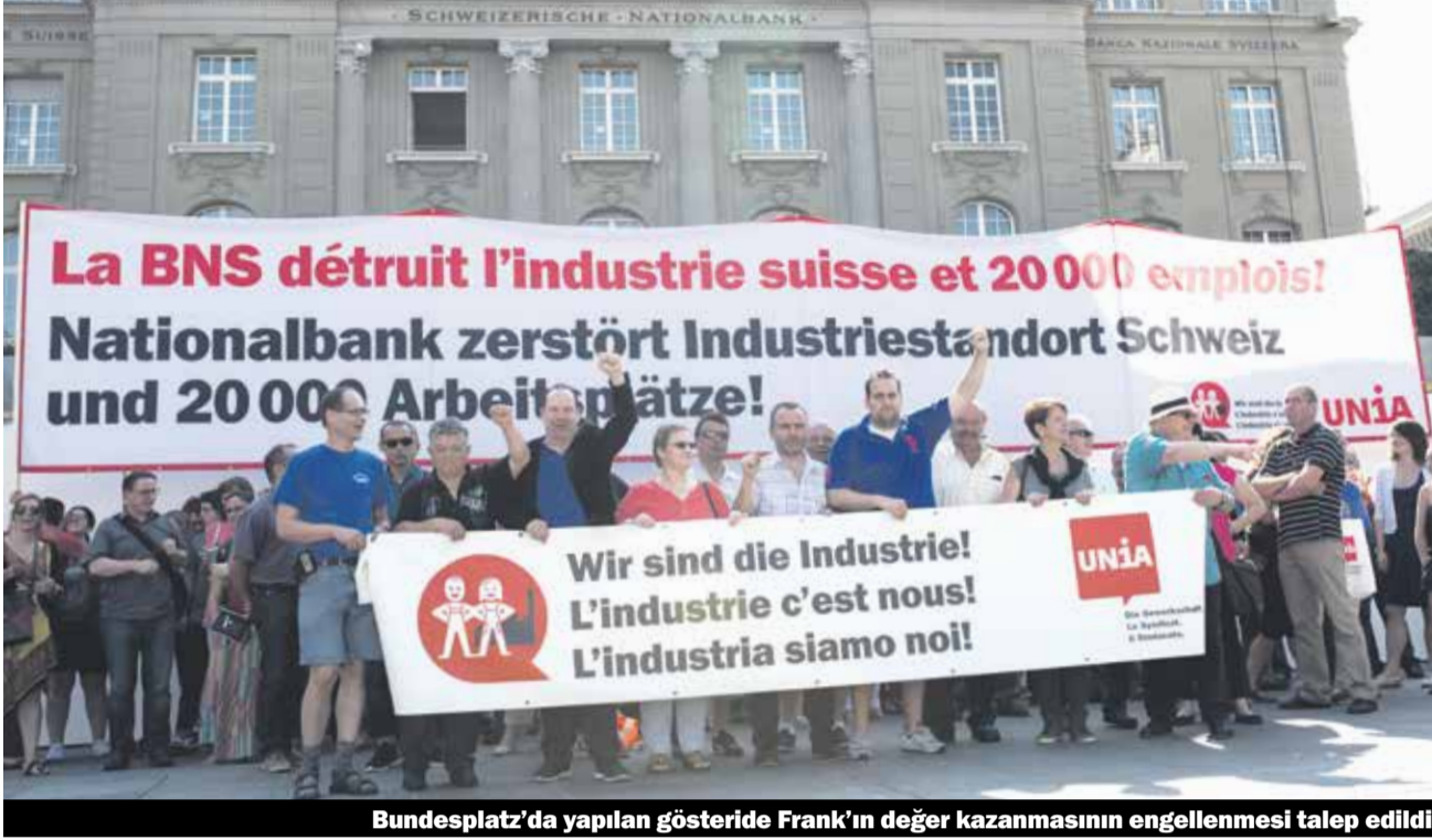
Bundesplatz'da yapılan gösteride Frank'ın değer kazanmasının engellenmesi talep edildi

Değişik işyerlerinden gelen yaklaşık altmış, Unia endüstri-delegesi, Bern'de Bundesplatz'da protesto eylemi düzenledi. Delegeler euro-döviz kurunun, İsviçre'nin endüstri ülkesi olarak kalmasını garanti altına alacak şekilde düzenlenmesini talep ettiler. Eğer İsviçre Merkez Bankası (SNB) müdahale etmez ise, İsviçre'de binlerce iş yeri yok olacak.