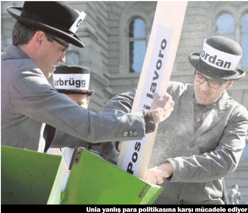
Unia yanlış para politikasına karşı mücadele ediyor

Sabit para kuru, kamu malıdır ve ekonomi ve toplum için, aynı hukusal güvencede olduğu gibi önemlidir. İşverenlerin hesaplarını yaparken, sabit para kuruna ihtiyaçları vardır. Oysa şimdi, döviz piyasalarında Frank spekülasyonları yapıyor ve bu nedenle Frank sabitliğini kaybediyor. Sürekli değişen İsviçre Frankı, işverenlerin makul bir planlama yapmasını engelliyor. İsviçre Frank'ının aşırı değer kazanması, turizm sektörünü ve İsviçre dış ticaretini olumsuz etkiliyor.