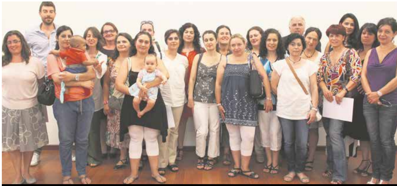
Meslek edinme kurslarına katılanlara sertifika veriliyor