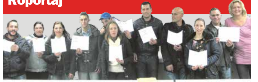
İns'de tarım alanında çalışan portekizli işçiler Unia'nın organize ettiği almanca kursunu başarıyla bitirdiler