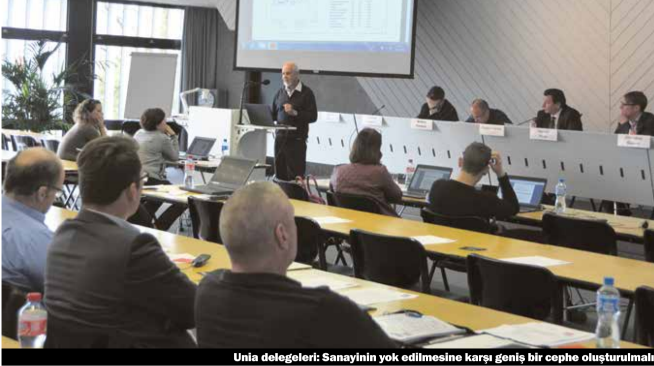
Unia delegeleri: Sanayinin yok edilmesine karşı geniş bir cephe oluşturulmalı