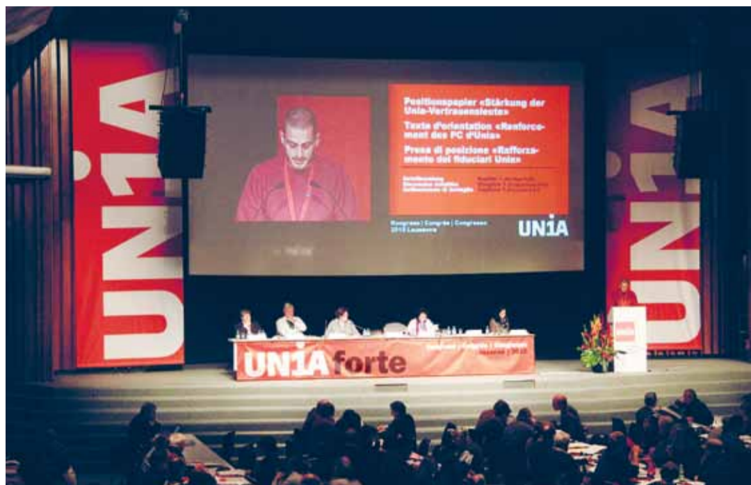
El Congreso del Unia 2010, en Losana, fijó como objetivo reforzar el trabajo de los enlaces sindicales.

En cuanto al aumento del número de afiliados(-as), el Unia no ha logrado alcanzar su ambicioso objetivo. Sin embargo, tras una fase de estabilización, se dibuja una clara tendencia al alza. El grado de organización sindical ha